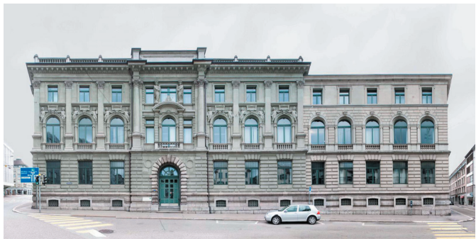
Hauptfassade an der Schützengasse 1

Das erforderliche Raumprogramm und die Rahmenbedingungen des Gerichtsbetriebs können im Gebäude gut umgesetzt werden. Durch die Weiternutzung von bestehender Bausubstanz wird der Wirtschaftlichkeit und der Nachhaltigkeit Rechnung getragen. Die als schützenswert eingestufte Liegenschaft erfüllt jedoch die Anforderungen hinsichtlich Brandschutz, Energieeffizienz und Erdbebensicherheit nicht und bedarf aufgrund des baulichen Zustands vor einer Neu- belegung einer tiefgreifenden Instandsetzung.