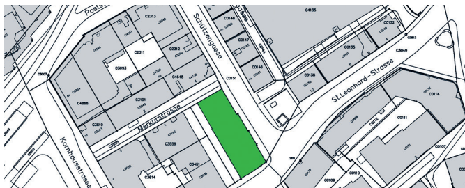
Grundstück C2304 mit Liegenschaft Schützengasse 1

Die Liegenschaft Schützengasse 1 liegt in unmittelbarer Nähe zum Hauptbahnhof, zu verschiedenen Bushaltestellen sowie zur Altstadt. Sie grenzt unmittelbar an die Merkurstrasse, die Schützengasse und die St.Leonhard-Strasse und bildet den östlichen Abschluss der Hofrandbebauung. Das Grundstück hat eine Fläche von 945 m 2 , davon deckt das Gebäude 748 m 2 ab. Das Gebäude steht auf der Ost-, Süd- und Nordseite der Liegenschaft direkt auf der Parzellengrenze. Die übrige Fläche im Westen dient der Innenhoferschliessung und der Parkierung.